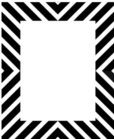
Feld für das Lichtbild

Die Bereitstellung der personenbezogenen Daten ist gesetzlich vorgeschrieben. Sie sind verpflichtet, die personenbezogenen Daten bereitzustellen. Die Nichtbereitstellung hat zur Folge, dass Ihr Antrag auf Umstellung und Verlängerung einer Fahrerlaubnis nicht bearbeitet werden kann.